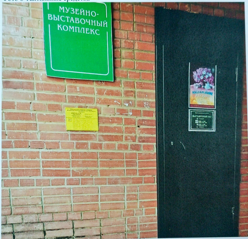
Фото 8 Тактильные средства

Комментарий к заключению: необходима установка акустических средств и рельефного покрытия пола