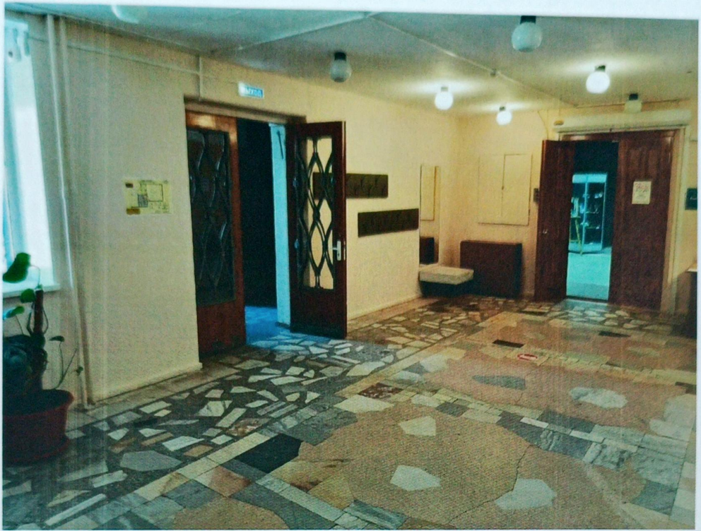
Фото 6 Пути эвакуации